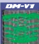
Simulacija na bljuzgavici